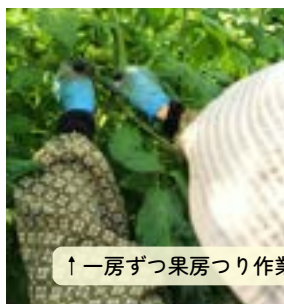
↑一房ずつ果房つり作業中

これからトマトの苦手な冬の時期に入るので、病気などにかからないよう、現在は余分な葉や芽をとったり、実が重さで取れないように果房を麻紐で補強する「果房つり」などの作業をしています。