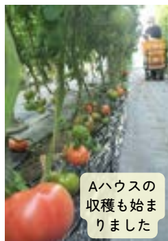
Aハウスの収穫も始まりました