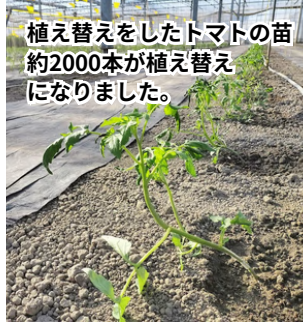
植え替えをしたトマトの苗 約2000本が植え替え になりました。

先月9月8日の台風13号の豪雨でトマトハウス全体が冠水し、植えたばかりのトマトの苗が水につかってしまった影響で、今期のトマトの収穫は大幅に遅れる見込みとなりました。