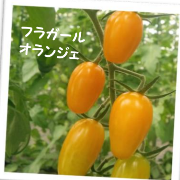
フラガール オレンジ

ミニトマトの方は生長が早いので、アイコやイエローアイコ、今年初めて作ったフラガール・オレンジなどが色づいてきました。