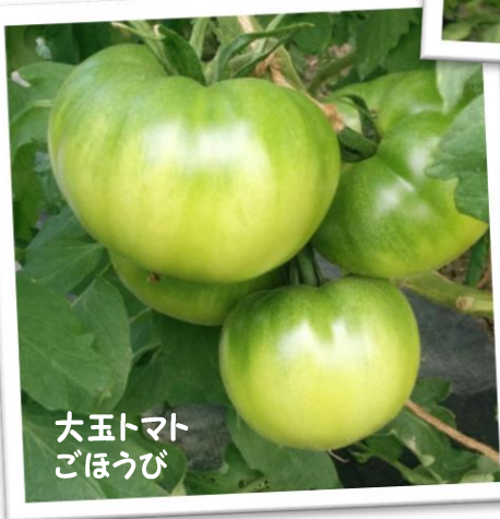
大玉トマト ごほうび